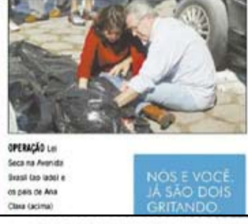
OPERAÇÃO Lei Seca no Avenida Brasil (ao lado) e no Povo da Ana Clara (ao lado)