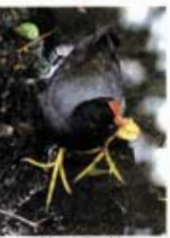
Frango-d'água voltou à lagoa