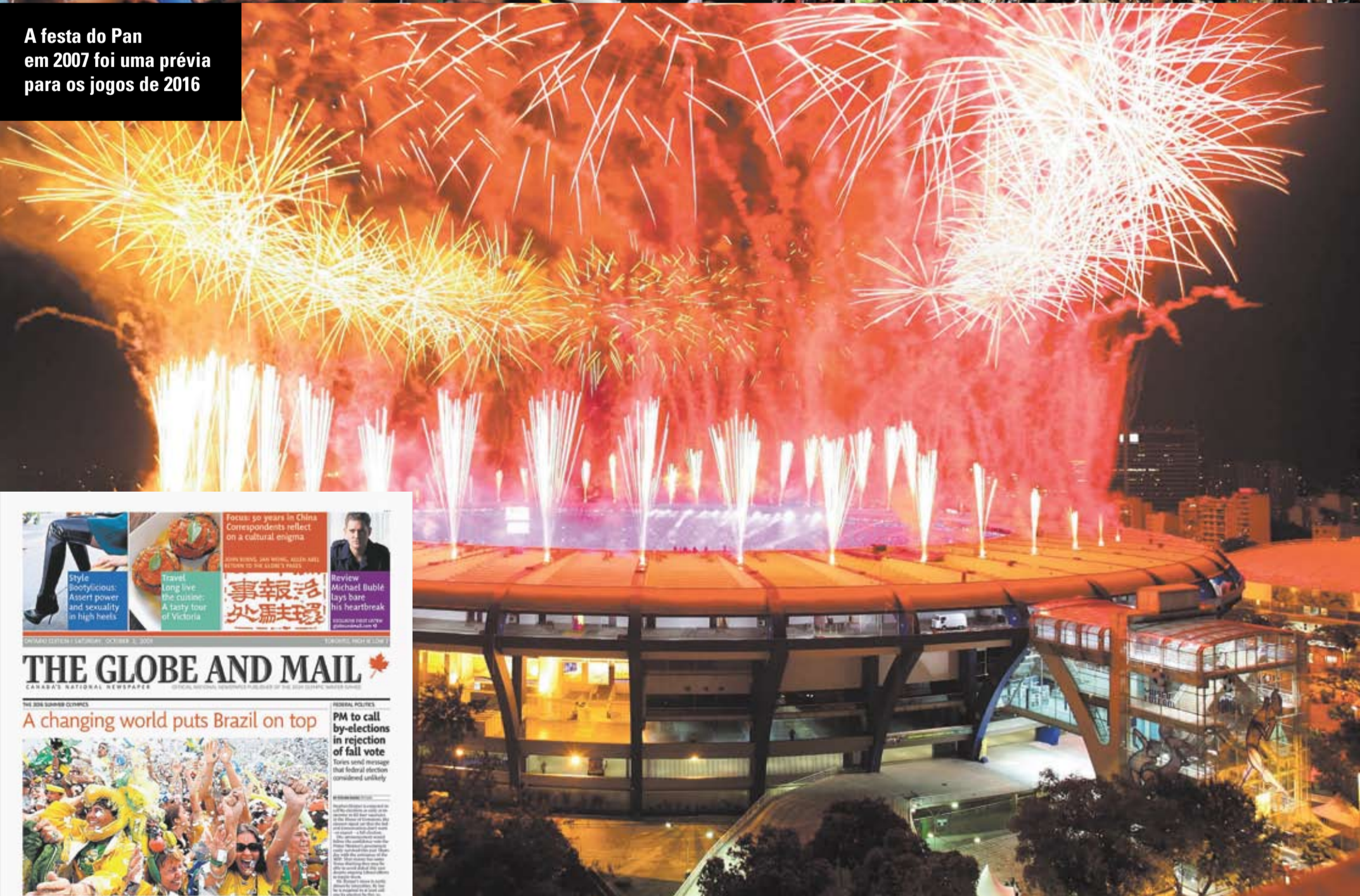
A festa do Pan em 2007 foi uma prévia para os jogos de 2016