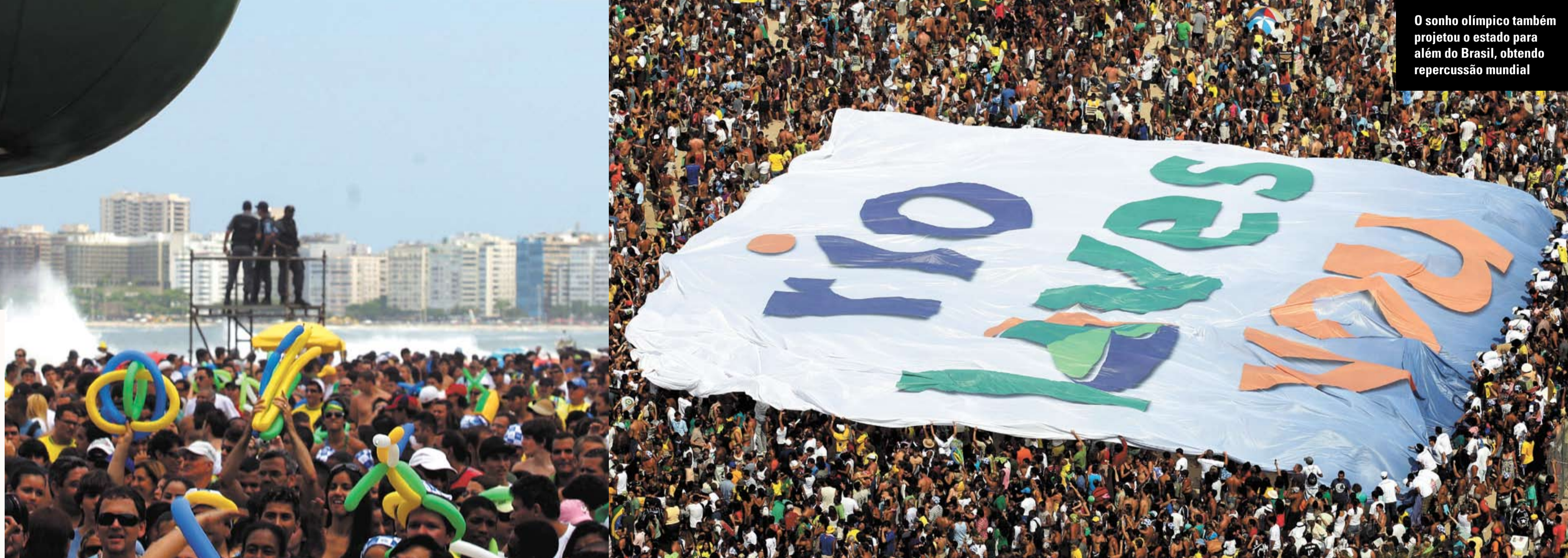
O sonho olímpico também projetou o estado para além do Brasil, obtendo repercussão mundial