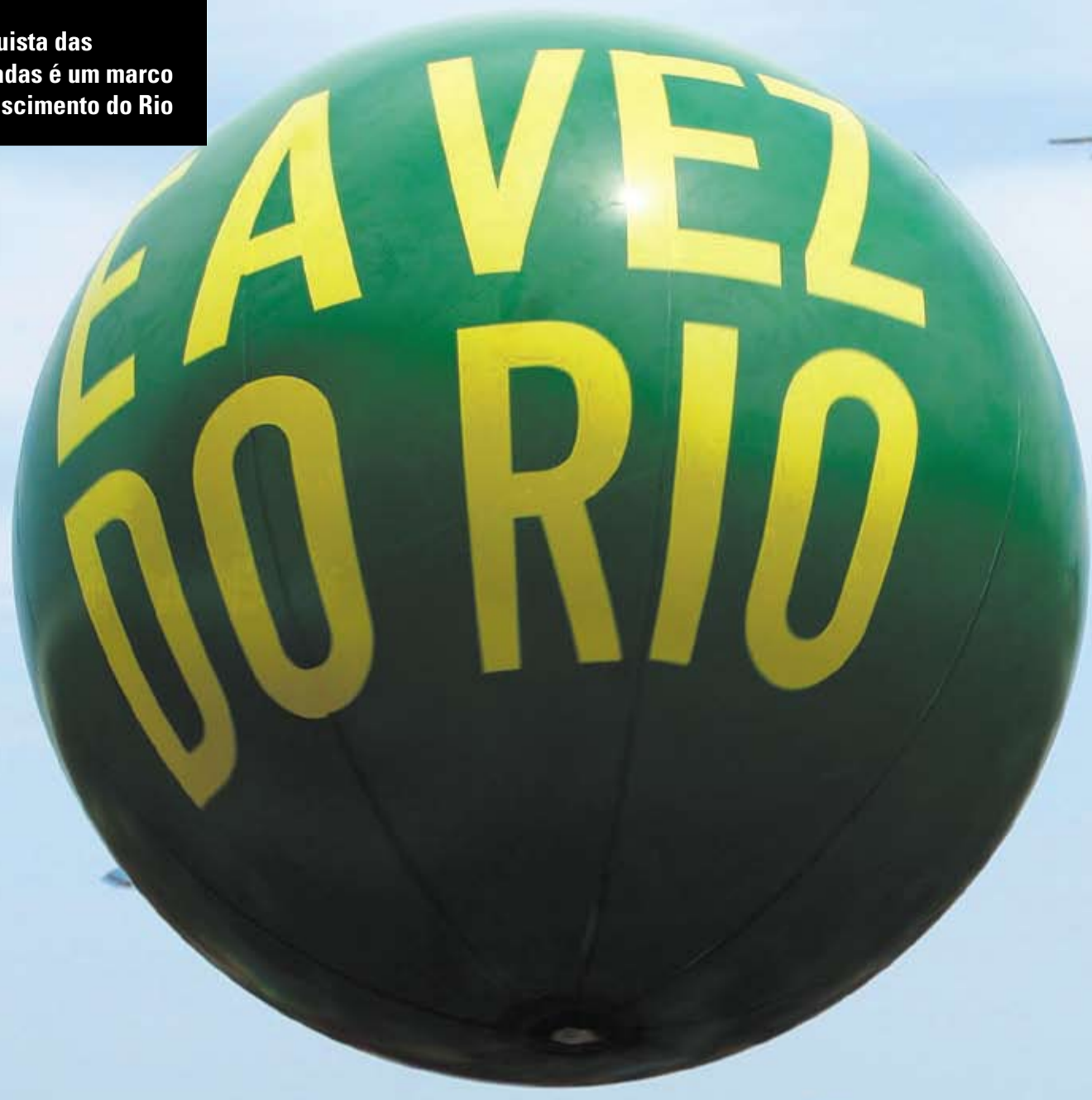
A conquista das Olimpíadas é um marco no renascimento do Rio