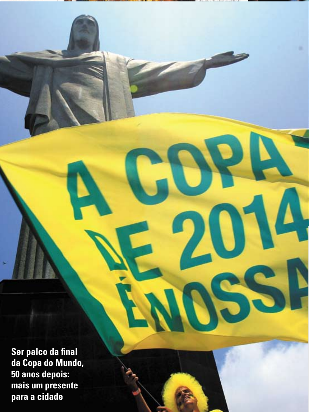
Ser palco da final da Copa do Mundo, 50 anos depois: mais um presente para a cidade